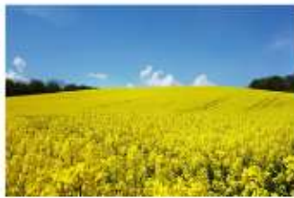
ทุ่งดอกเบญจมาศ