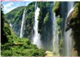
ปัทมกร้อยสาย