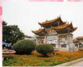
ประติมากรรมงาช้าง