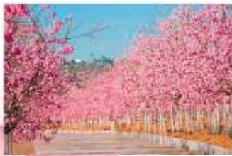
หุบเขายาคุระ