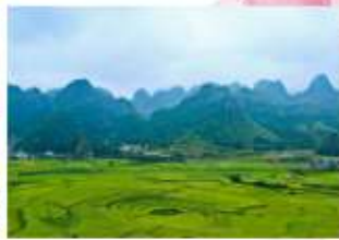
ป่าภูเขาหมื่นยอด