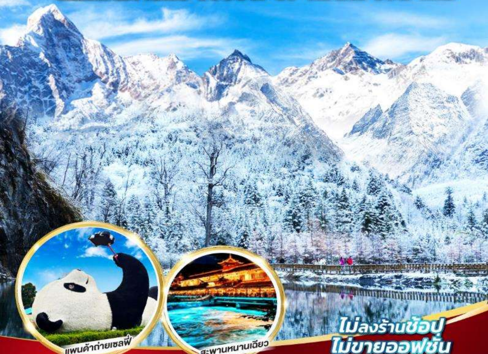
แพนด้ายักษ์เซลฟี่

หมี่แพนด้ายักษ์ ช้อปปิ้ง POP MART 5วัน 4คืน