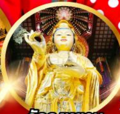
วัดดงหยวน