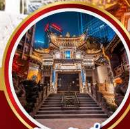
วัดหลัวอัน