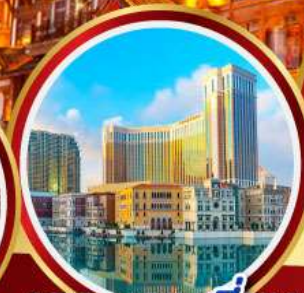
เดอะเวเนเซียน