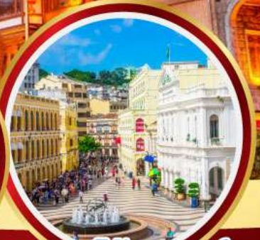
เซนาโดสแควร์