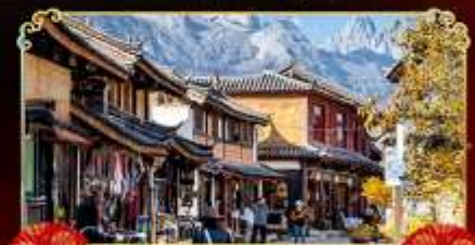
เมืองเก่าไปซา