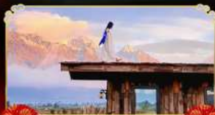
YUN TI YANG CAFE