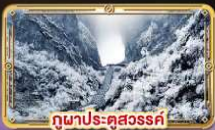
ภูผาประตูสวรรค์