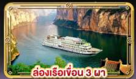
ล่องเรือเขื่อน 3 ภา