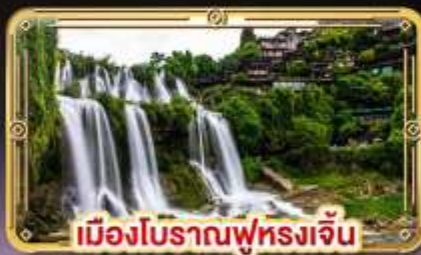
เมืองโบราณฟุหลงเจิ้น