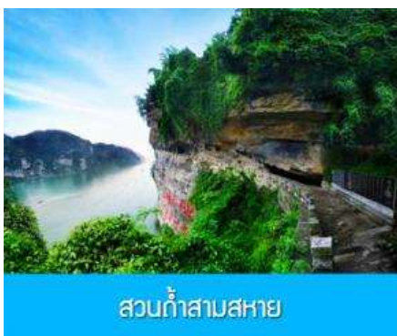
สวนถ้ำสามสหาย