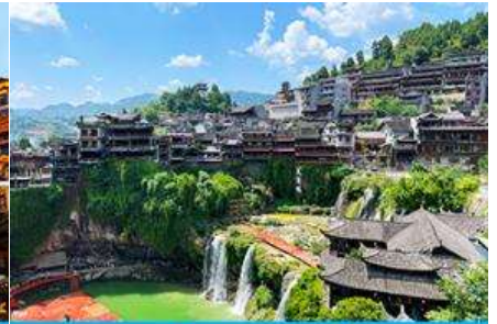
เมืองโบราณผู่หลงเจี้ยน