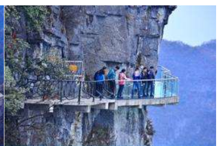
หน้าผาลอยฟ้าทางเดินกระแจะ