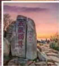
หินแกะสลักในสมัย ราชวงศ์ถัง