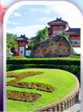
อุทยานหนานซาน