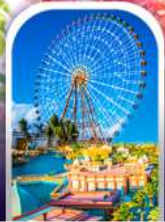
เมืองแฟนตาซี