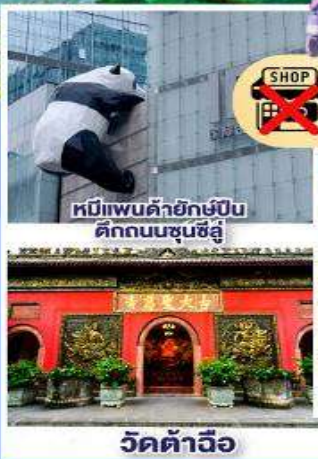
หมีแพนด้ายักษ์กับ ตึกถนนชุนซีลู่