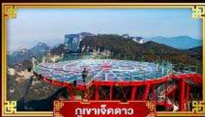
กุเขาเจ็ดดาว