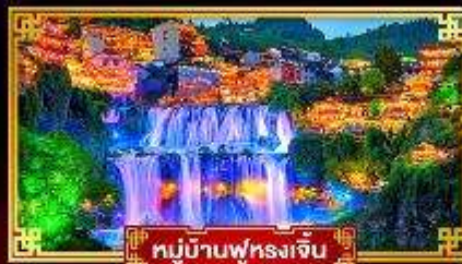
หมู่บ้านฟุรงเจิน