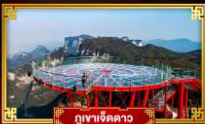
กูเขาเจ็ดดาว