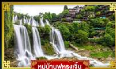
หมู่บ้านฟุทงเจี้ยน