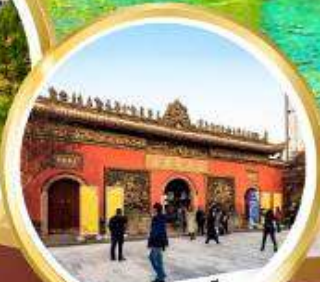
วัดต้าฉิว