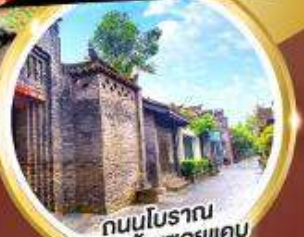
ถนนโบราณ ซอยกว้างชอยแคบ