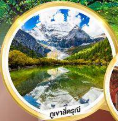
ภูเขาสีดรุณี