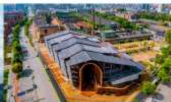
ลานวัฒนธรรมเทาซีชว่น