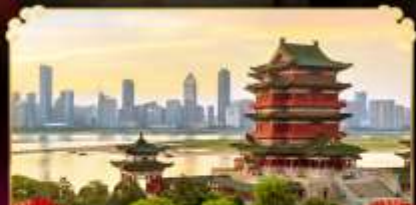
หอถึงหวังเก๋อ