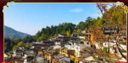
หมู่บ้านทวงหลิง