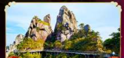
เวาซานซิงซาน