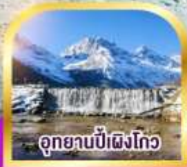
อุทยานป่าเผิงโกว