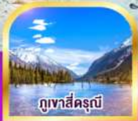
ภูเขาสัตรุณี