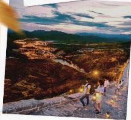
กำแพงเมืองจีนซื่อหม่าโถ