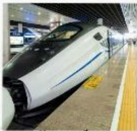
รถไฟความเร็วสูง สู่จิวจ้ายโกว