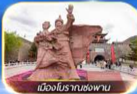
เมืองโบราณซ่งพาน