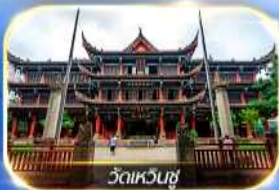
วัดเหวินชู่