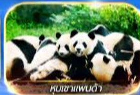
หุบเขาแพนด้า

สัมผัสความงามของธรรมชาติ 2 อุทยาน อุทยานจิวจ้ายโกวและอุทยานน้ำแข็งต้ากู่