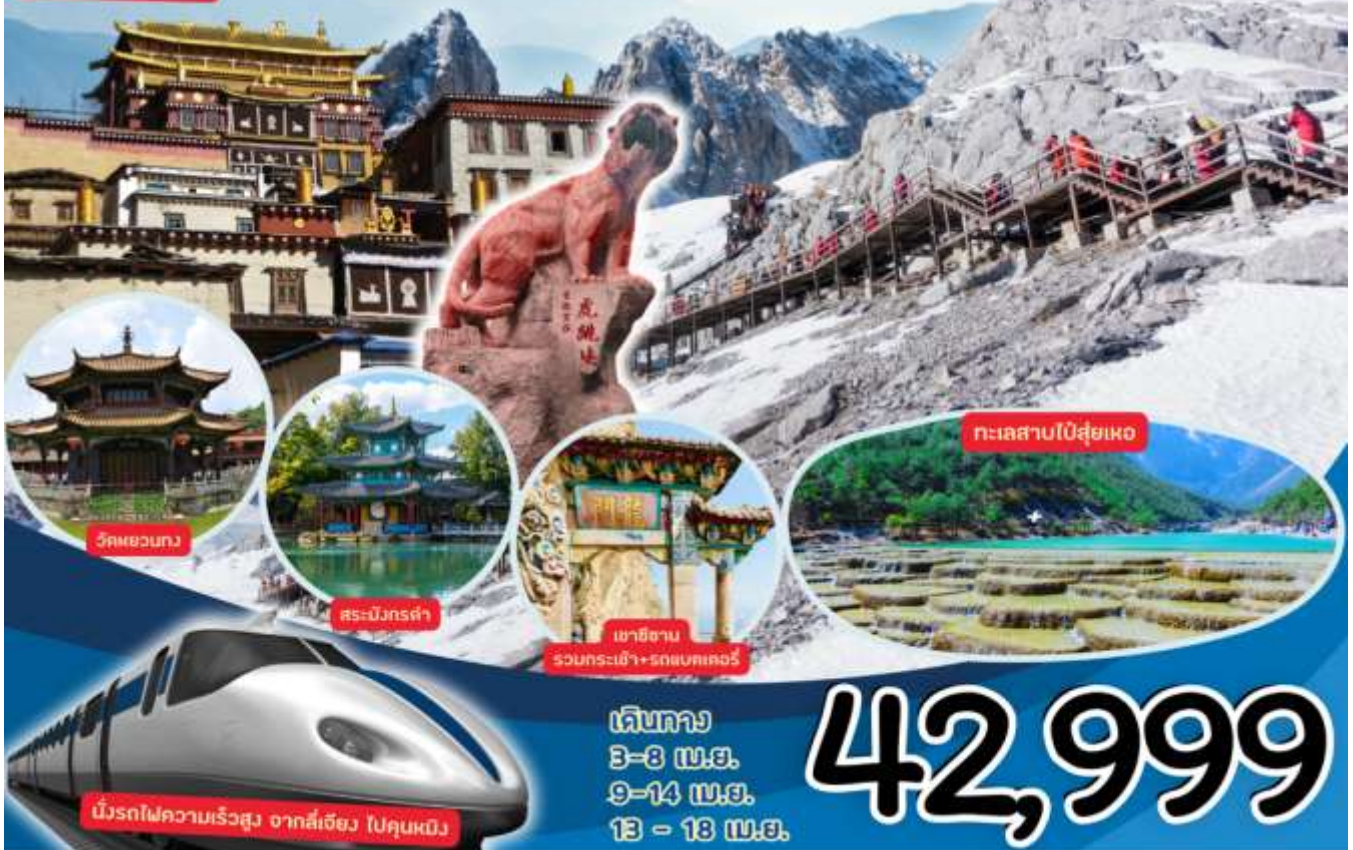
วัดผอมกวาง