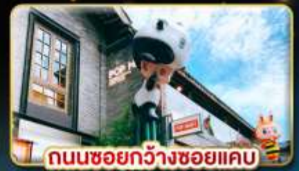
ถนนชอยกว้างชอยแคบ