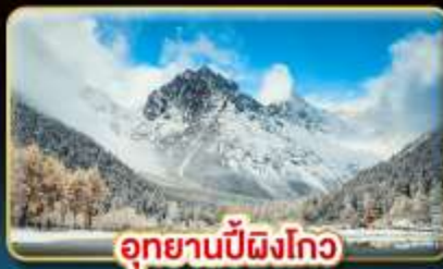
อุทยานปี้ผิงโกว