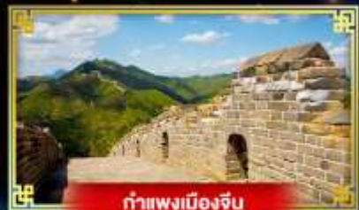
กำแพงเมืองจีน