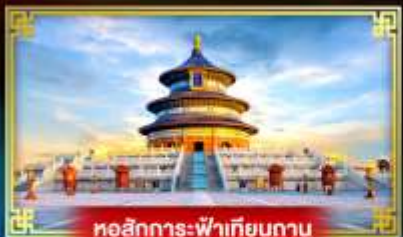
หอสีกการะฟ้าเทียนถาน