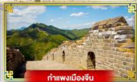
กำแพงเมืองจีน