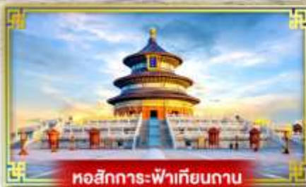
หอสักการะฟ้าเทียนถาน