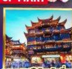
ตลาด 100 ปี เจิ้งหวงเหมียว