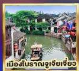
เมืองโบราณจูเจียเจี้ยว