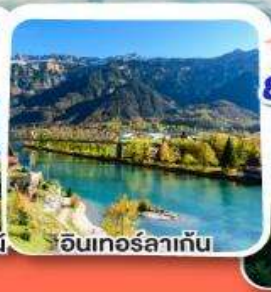
อินเทอร์ลาเก็น