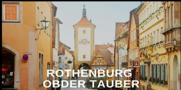
ROTHENBURG OBDER TAUBER