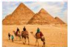
พีรามิดขั้นบันได