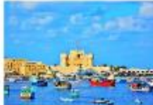
เมืองอเล็กซานเดรีย

** พักที่ Mamlouk Pyramids Hotel 4* หรือเทียบเท่า **