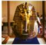
The Egyptian Museum

** พักที่ Mamlouk Pyramids Hotel 4* หรือเทียบเท่า **