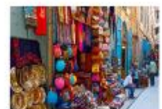
ตลาดข่านเอลคาลิลี

20.50 น. ออกเดินทางสู่อิสตันบูล เที่ยวบิน TK695