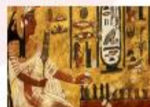
พิพิธภัณฑ์สถานแห่งชาติอียิปต์