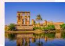
วิหารฟิเล

16.25 น. ออกเดินทางสู่กรุงไคโร สายการบิน Egypt Airlines เที่ยวบิน MS295