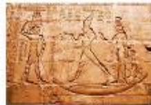
วิหารเอ็ดฟู