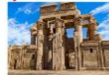
วิหารคอมมอมโบ