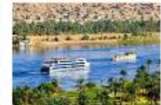
พักผ่อนตามอัธยาศัยบนเรือสำราญ

** พักที่ Royal Beau Rivage Nile cruise 5* หรือเทียบเท่า **