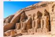
มหาวิหารอาบูซิมเบล

** พักที่ Royal Beau Rivage Nile cruise 5* หรือเทียบเท่า **