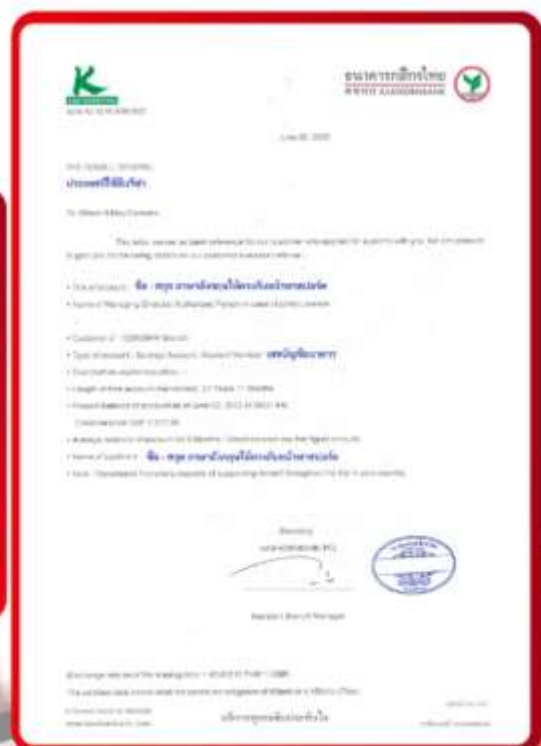
ตัวอย่าง Bank Guarantee ผู้สมัครต้องขอกับธนาคาร