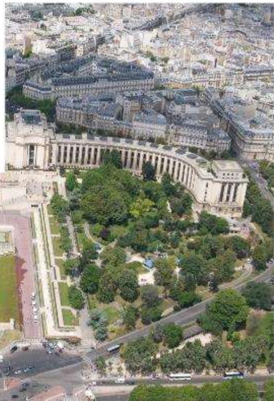
มุมมองเมืองปารีสจากหอไอเฟล