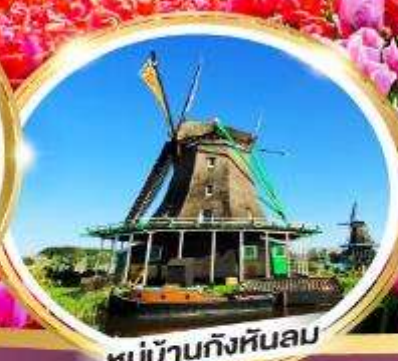
หมู่บ้านกังหันลม