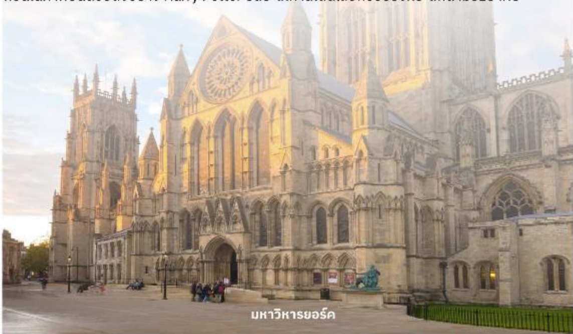
มหาวิหารยอร์ก

จากนั้นนำท่านเดินต่อไปที่ The Shambles (เดอะแซมเบิล) เป็นสถานที่ที่มีความคล้ายกับตรอกไดอากอนในภาพยนตร์ชื่อดังอย่าง Harry Potter อีสระให้ท่านเดินเลือกซื้อของที่ระลึกตามอัธยาศัย