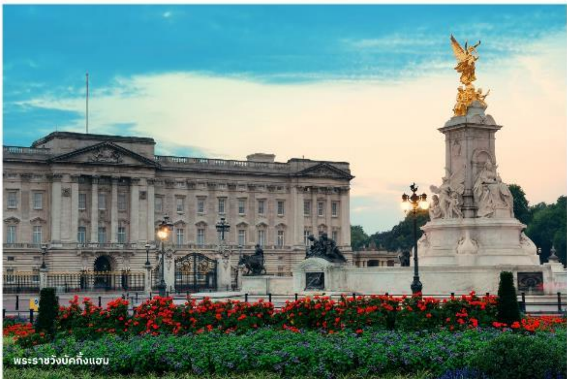
พระราชวังบักกิงแฮม