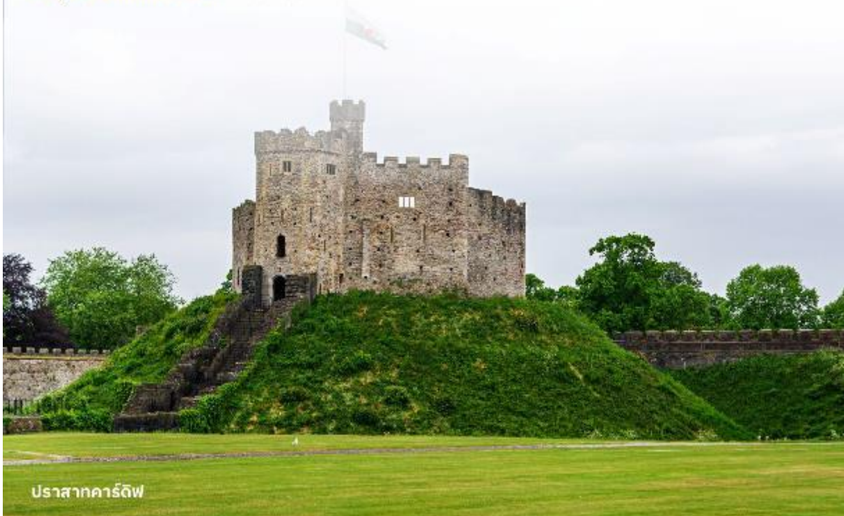
ปราสาทคาร์ดิฟฟ์

บริการอาหารค่ำ ณ ภัตตาคาร นำท่านเข้าสู่ที่พัก Clayton Hotel Cardiff หรือเทียบเท่า