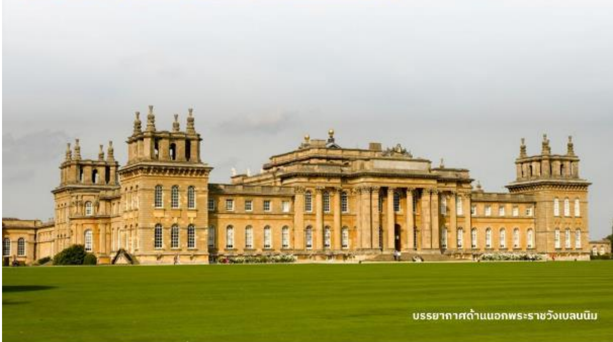
บรรยากาศด้านนอกพระราชวังเบลนนิม

DoubleTree by Hilton Hotel Londo -Docklands Riverside หรือเทียบเท่า