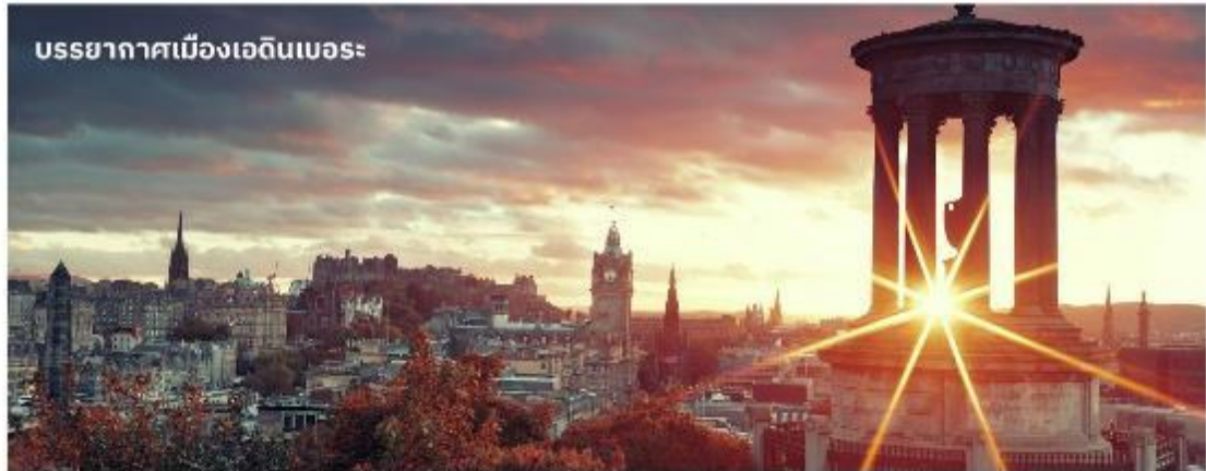
บรรยากาศเมืองเอ็ดินบะระ