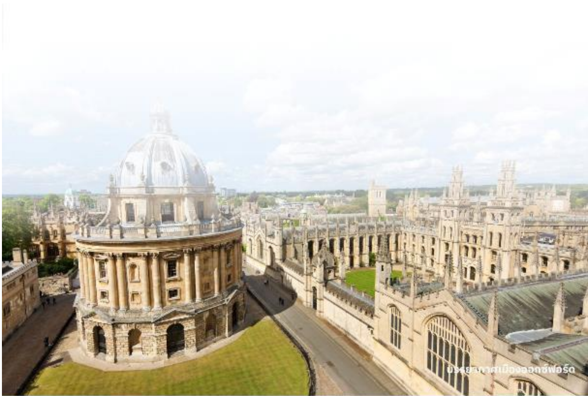
บรรยากาศเมืองออกซ์ฟอร์ด

จากนั้นนำท่านเดินทางไปยัง พระราชวังเบลนนิม ในมณฑลออกฟอร์ดเชียร์ ที่นี่เป็นที่เกิดของ เซอร์วินสตัน เชอร์ชิลล์ ผู้นำอังกฤษในสมัยสงครามโลกครั้งที่ 2 และเป็นพระราชวังสโตนบารอกที่งดงามที่สุดในอังกฤษ Blenheim Palace นั้นเป็นวังเดียวในอังกฤษที่เจ้าของไม่ได้เป็นเชื้อพระวงศ์ แต่วังแห่งนี้เป็นที่พำนักอาศัยหลักของ Dukes of Marlborough และภายหลังได้รับการยกย่องเป็น World Heritage Site โดย UNESCO ในปี ค.ศ. 1987 อิสระให้ท่านถ่ายภาพพระราชวังจากด้านนอกตามอัธยาศัย