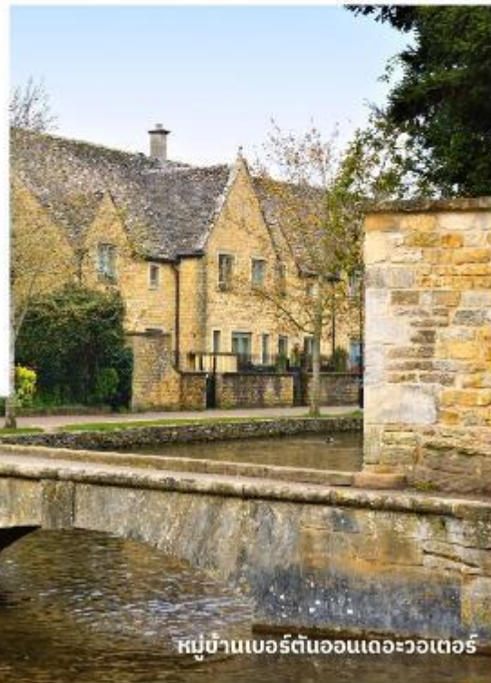
หมู่บ้านเบอร์ตันออนเดอะวอเตอร์

จากนั้นนำท่านเดินทางสู่ เขตคอตส์วอลส์ เขตหมู่บ้านชนบทแสนสวยของอังกฤษถึง 70 หมู่บ้าน ใช้เวลาเดินทางประมาณ 3.30 ชั่วโมง นำท่านเที่ยวชม หมู่บ้านเบอร์ตันออนเดอะวอเตอร์ (Bourton On The Water) หมู่บ้านเล็ก ๆ ที่รู้จักกันในนามของ “เวนิส แห่งคอตวอลส์” เมืองที่โด่งดังที่สุดในคอตส์วอลส์ ดูเจียมสงบมีลำธารสายเล็ก ๆ (แม่น้ำวินด์ริช) ไหลผ่านกลางเมือง และมีสะพานหินทอดข้ามน้ำเป็นช่วง ๆ กับต้นวิลโลว์ที่แกว่งกิ่งก้านใบอยู่ริมน้ำ