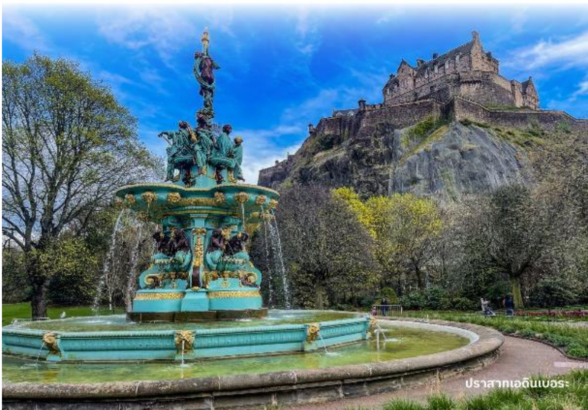
ปราสาทเอดินเบอระ

ผู้ตรงข้ามเป็นรัฐสภาแห่งชาติสกอตอันน่าทึ่งด้วยสถาปัตยกรรมร่วมสมัย