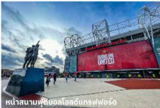
หน้าสนามฟุตบอลโอลด์แทรฟฟอร์ด