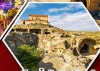
เมืองดำอพิลิสต์ซเคห์