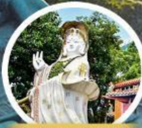
เจ้าแม่กวนอิม รัฟลีส เบย์