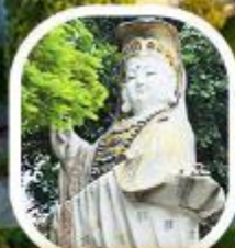
เจ้าแม่กวนอิม รัชพลี เมย์