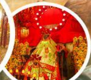
เจ้าแม่กวนอิมช่องซ่า