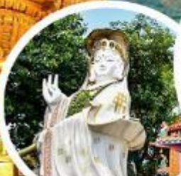
เจ้าแม่กวนอิม ธิพัลส์ เบย์