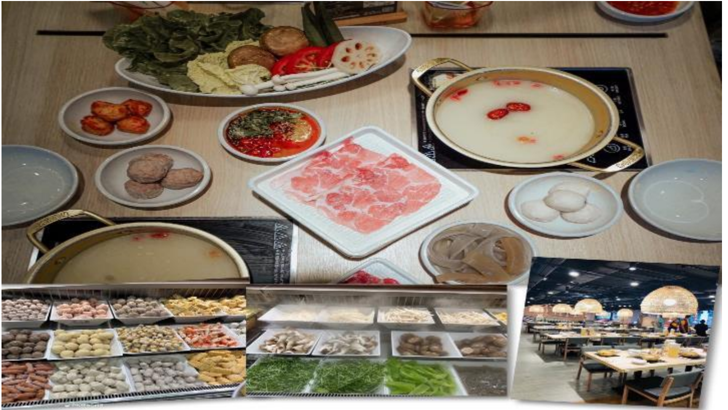
เที่ยง รับประทานอาหารเที่ยง ณ ภัตตาคาร (5) เมนูชาบู