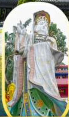
วัดเจ้าแม่กวนอิมรี พลัสเบย์