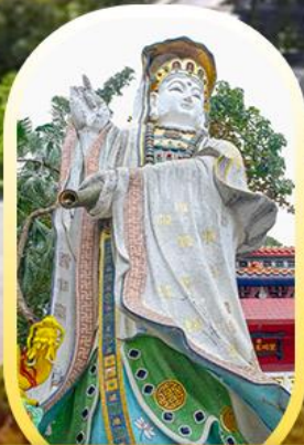
วัดเจ้าแม่กวนอิมรี พลัสเบย์