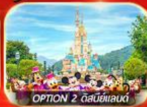
OPTION 2 ดิสนีย์แลนด์

เต็มอิ่ม ทั้งไหว้พระ-ขอพร การเงิน การงานความรักและซ่อมปัง