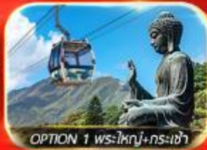
OPTION 1 พระใหญ่+กรงเจ้า