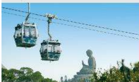
กระเช้าองปิง