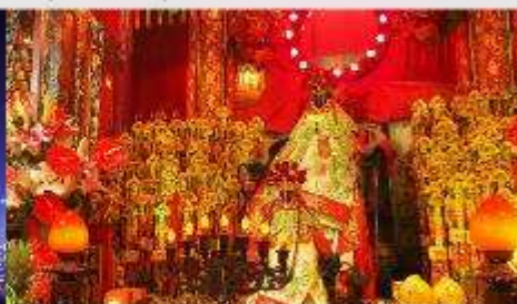
วัดเจ้าแม่กวนอิมของซ่า

*ทางบริษัทฯ ขอสงวนสิทธิ์ในการสลับโปรแกรมทัวร์ตามความเหมาะสมขึ้นอยู่กับสถานการณ์ปัจจุบัน โดยคำนึงถึงผลประโยชน์ของลูกค้าเป็นสำคัญ