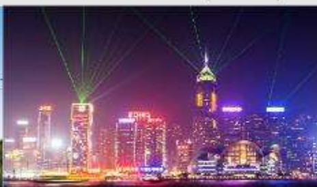
Symphony of Lights