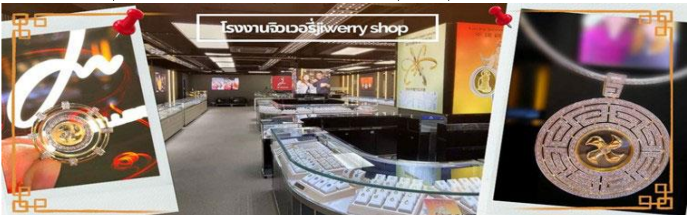
โรงงานจิวเวอรี่ jewelry shop

จากนั้นนำท่านชม โรงงานจิวเวอรี่ ซึ่งเป็นโรงงานที่มีชื่อเสียงที่สุดของฮ่องกงในเรื่องการออกแบบเครื่องประดับ อาทิเช่น จี้ และแหวนกั้งหัน ที่สวยงามโดดเด่นไม่เหมือนใคร ซึ่งถือกำเนิดขึ้นที่นี่และมีชื่อเสียงที่สุดใช้เป็นเครื่องประดับติดตัว และเสริมดวงชะตา สินค้าทุกชิ้นมีเอกสารรับประกันคุณภาพเปลี่ยน ซ่อม ได้ตลอดอายุการใช้งาน หากเกิดการชำรุดจากสินค้าไม่ใช่อุบัติเหตุ และนำท่านเลือกซื้อเครื่องประดับที่ ร้านหยก ซึ่งคนจีนนั้นถือว่าหยกเป็นหิน ที่เป็นตัวแทนของความสวยงามและความเป็นสิริมงคล มีความเชื่อว่าหยกมงคล ถ้าพกติดตัวไว้จะอายุยืนและสุขภาพดี