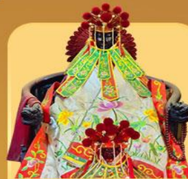
เจ้าแม่กวนอิมสองขำ