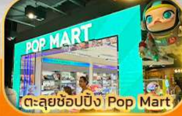
ตะลุยช้อปปิ้ง Ping Pop Mart