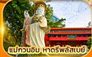
แม่กวนอิม หาดรีพลัสเบย์