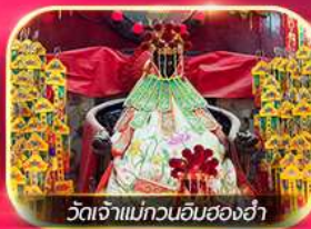
วัดเจ้าแม่กวนอิมฮองฮำ