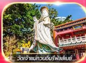
วัดเจ้าแม่กวนอิมรพีพลัสเบย์