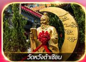
วัดหวงต้าเซียน