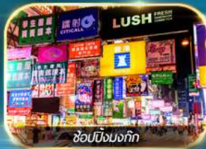
ช้อปปิ้งมงก๊ก

เต็มอิ่มทั้งบุญ และ ช้อปปิ้งแบบจัดเต็ม จิมซาจุ่ย มงก๊ก