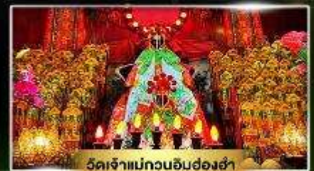
วัดเจ้าแม่กวนอิมฮ่องฮ่า