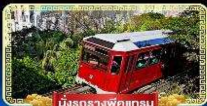
นิงรถรางพิกเกรม

นิงกระเช้ามองปิง 360 องศา บินลัดฟ้าไปมู..สู่เกาะฮ่องกง