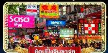
ช้อปปิ้งจิมซาจู้