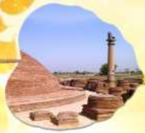
เมืองหลวงแคว้นอานาจักรวัชชี แคว้นชมพูทวีป