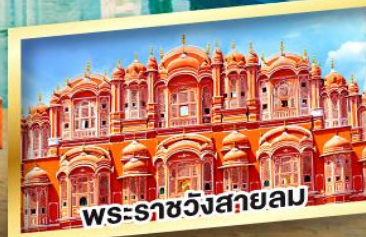
พระราชวังสลายม