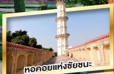
หอคอยแห่งชัยชนะ