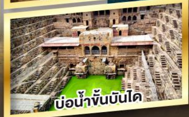
บ่อน้ำจันบันโด