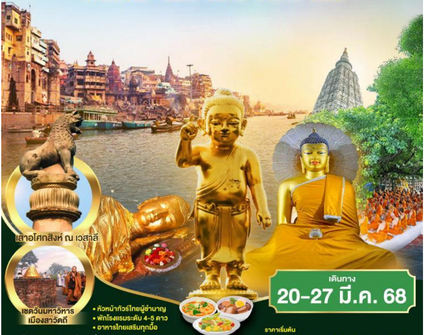
เสาอโศกสิงห์ ณ เวสาลี