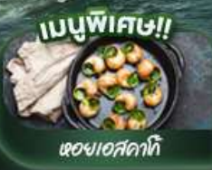
ของแถมพิเศษ!!